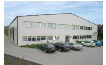
K&K Firmenzentrale in Fernwald. In einer großräumigen und modern ausgestatteten Fertigungshalle planen und konstruieren wir Ihre Verpackungsmaschine.

Einzelne Details bis hin zu Bewegungsabläufen von einzelnen Baugruppen können wir auf dem Bildschirm erkennen, simulieren und optimieren.